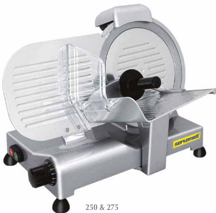
250 & 275